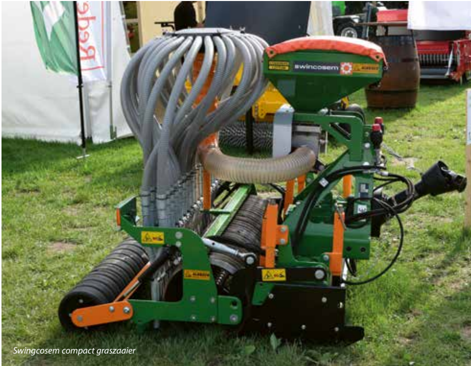
Swingosem compact graszaaiër