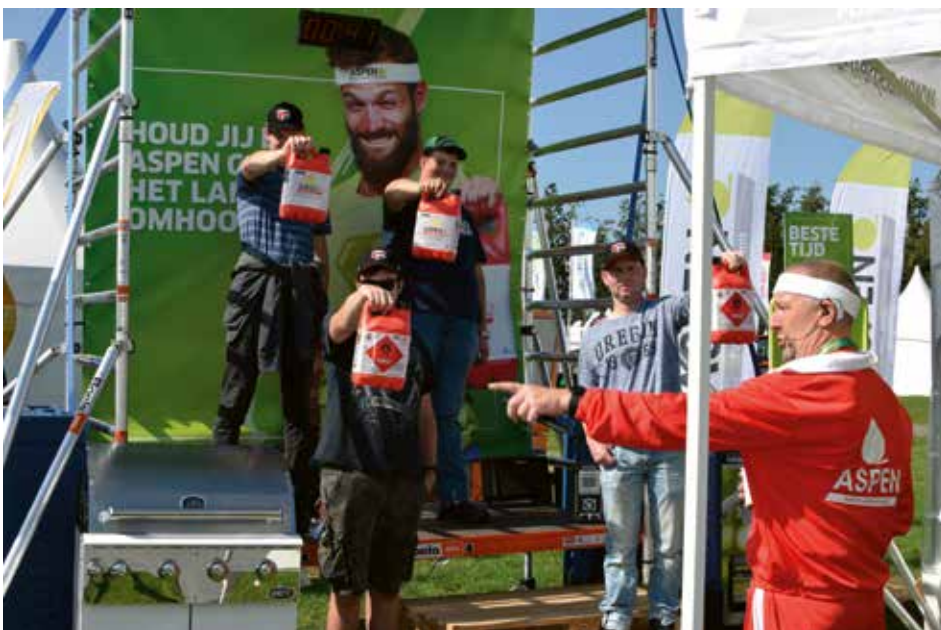
Ook op de stand van Aspen was het een drukte van jewelste door de powerchallenge