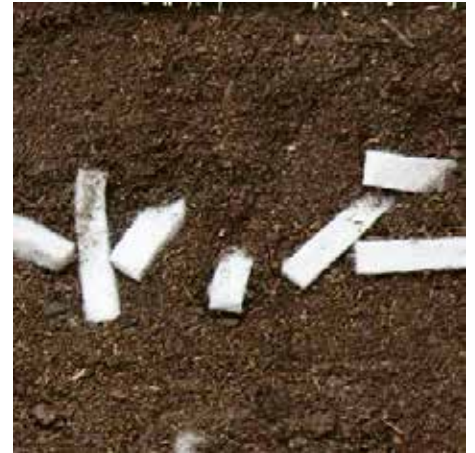
De strips zijn goed door de grond te mengen, zorgen voor actieve wortelgroei, gaan verdichting tegen en houden de grond langer vochtig.

Water wordt gegeven op basis van ervaring en vaak ook op het gevoel, maar het kan ook anders. Agro de Arend biedt nu het Florja Treemonitoring Platform aan. Dankzij sensoren in de grond kan de beheerder op afstand zien wat de status van de boom is en wat de boom nodig heeft. In combinatie met WLAN-netwerken is Florja een hulpmiddel om de status van bomen en planten op elk moment te bekijken en te weten te komen wanneer het nodig is om maatregelen te nemen. Joan: ‘De kosten voor extra watergeven zijn geen sluitpost, maar meestal een extra post. Haal een deel van deze kosten naar voren door vooraf na te denken over de nazorg. Daardoor houd je grip op je uitgaven en grip op het water. Je kunt de kosten drukken, en ook nog eens op een duurzame manier; dat is toch geweldig?’