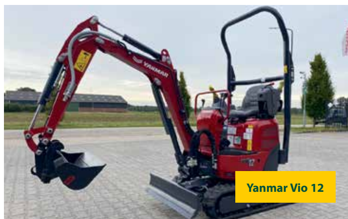
Yanmar Vio 12