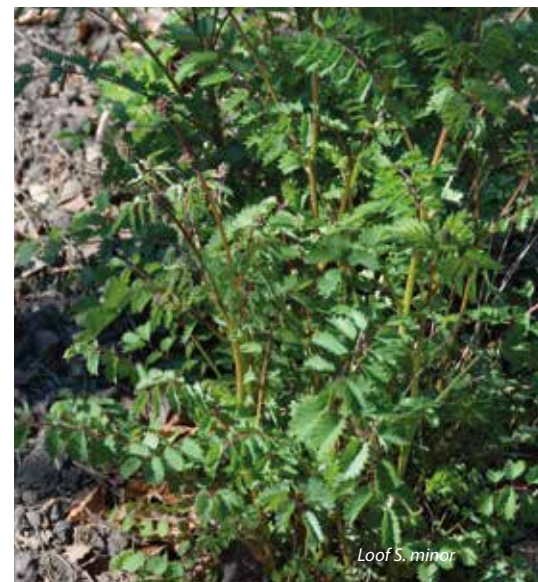
Loof S. minor

Wat een aparte vorm heeft Sanguisorba 'Blackthorn'. De naam heeft niets te maken met sleedoorn of zwarte doorn; de plant is vernoemd naar een kwekerij in Engeland. Door de duidelijk opstaande dikke aren in een roze tint valt de plant goed op. Het is echt een toevoeging aan de in de natuur voorkomende Sanguisorba canadensis , die wit bloeit. Tot laat in de herfst blijft de plant zijn sierwaarde houden. Het blad is wat grover dan dat van de officinalis -types en mooi in combinatie met bijvoorbeeld laatbloeiende tulpen. Zo heb je het hele seizoen plezier van de plant.