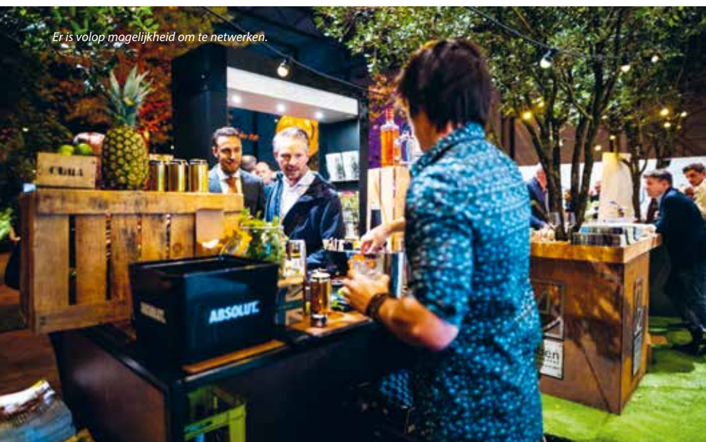
Er is volop mogelijkheid om te netwerken.