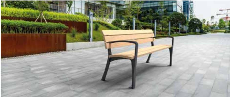
Tuinbank Laths Comfort