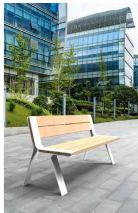
Tuinbank Ligna Comfort in witte uitvoering