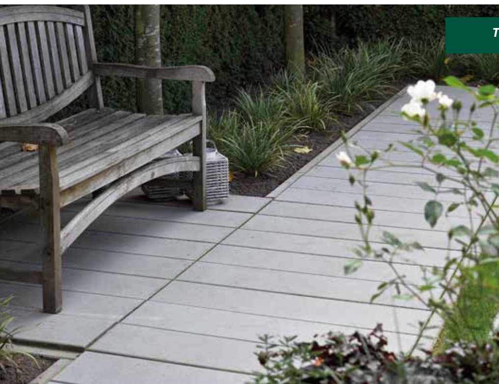
Twee maten één geheel

In Weert heeft hovenier Forma Verde enkele producten van Ebema toegepast. Zoals de Ebema_Stone&Style Megategel Carreau in twee verschillende maten. Het verschil in maten is gebruikt om het verschil tussen pad en terras aan de duiden, waarbij is gekozen om dezelfde kleur en afwerking te hanteren. Waardoor het toch een geheel blijft en mooie samenhang vertoont. De neutrale kleur zorgt er tevens voor dat de bloemenbakken met cortenstaal mooi tot recht komen en het groen eruit springt.