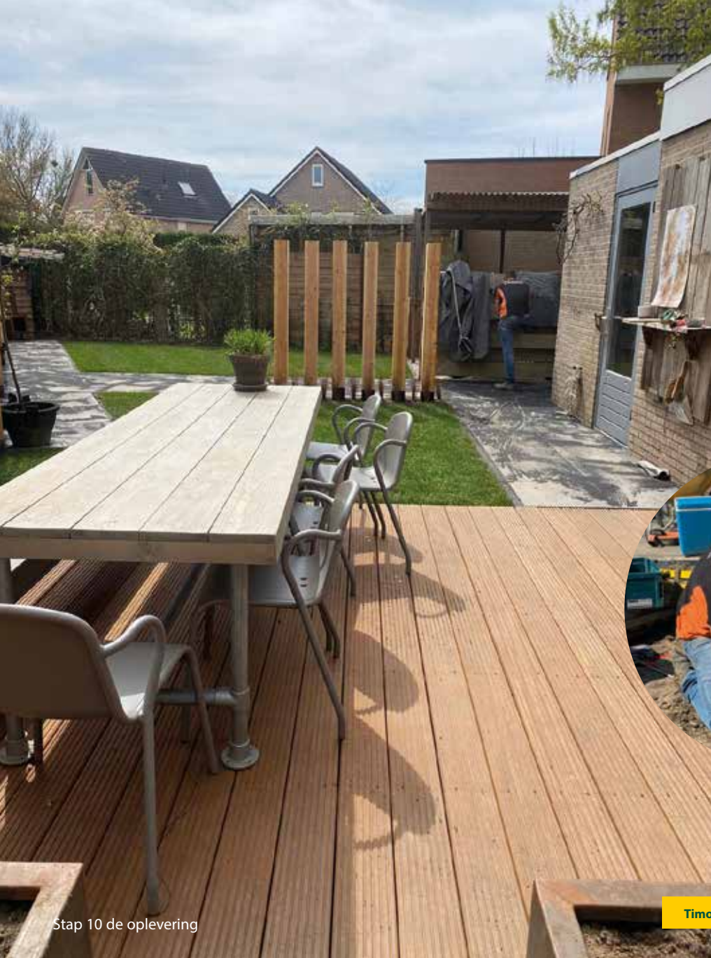
Stap 10 de oplevering

In deze nieuwe How to-rubriek gaan we in op de praktische aspecten van het hoveniersvak. Ditmaal gaat het om een vlonderterras. Hoe leg je in tien stappen een strak vlonderterras aan waar je klant jarenlang plezier van heeft?