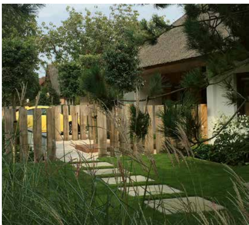
Project op Texel. ‘Het begeleiden van de tuin is nazorg voor de klant en daarmee borg ik dat het beeld dat ik voor ogen had, wordt behaald.’