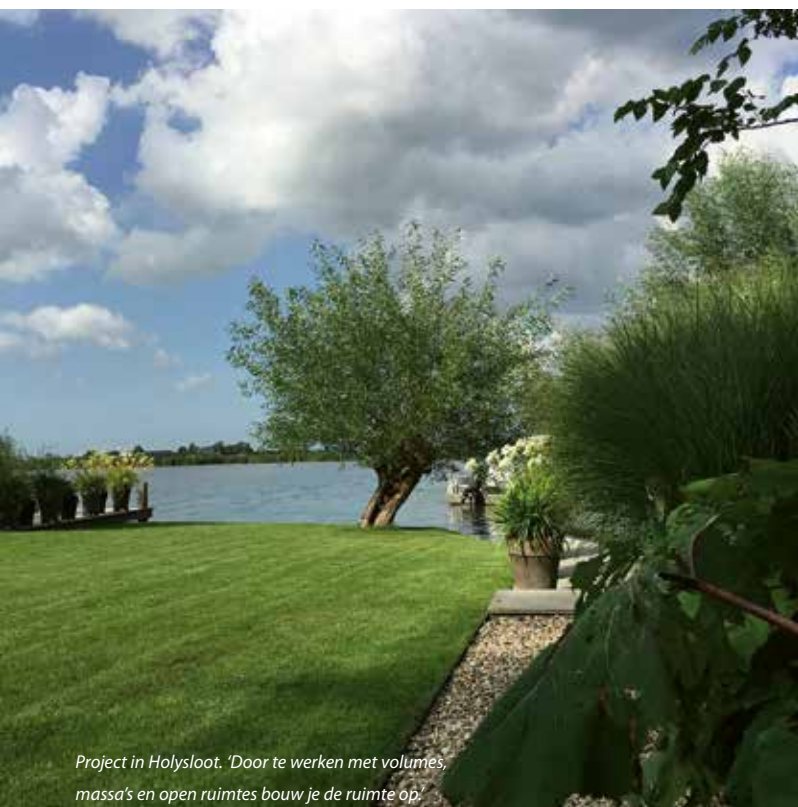
Project in Holysloot. 'Door te werken met volumes, massa's en open ruimtes bouw je de ruimte op.'