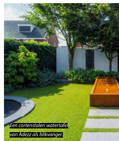
Een cortenstalen watertafel van Adezz als blikvanger.

In de praktijk zijn er tal van manieren om zo'n zichttas te versterken. Poppelaars: 'Een cortenstalen plantenbak of watertafel kan dienen als eindpunt. Ronde of rechte borderranden of modulaire oplossingen kunnen een lijn begeleiden en herhalen. Met een constructie van SteigerbuisOnline, zoals ik die heb toegepast in de nieuwe inspiratietuin in Bloemenpark Appeltern, krijgt de zichtlijn letterlijk een kader.' Poppelaars vervolgt: 'Voor de uitvoerende hovenier zit de kwaliteit hier in de maatvoering. Precisie is cruciaal bij constructieve elementen: klopt de maatvoering, staat het object exact in lijn, is de herhaling consequent?'