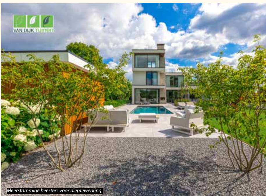
Meerstammige heesters voor dieptewerking.

'Extra gelaagdheid ontstaat door materialen te combineren, bijvoorbeeld een tegel naast een robuust betonelement'