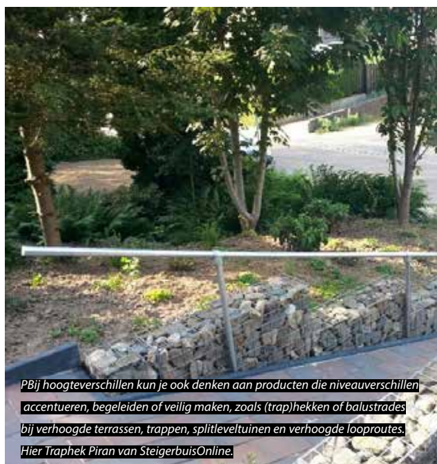
Bij hoogteverschillen kun je ook denken aan producten die niveauverschillen accentueren, begeleiden of veilig maken, zoals (trap)hekken of balustrades bij verhoogde terrassen, trappen, splitleveltuinen en verhoogde looproutes. Hier Traphek Piran van SteigerbuisOnline.