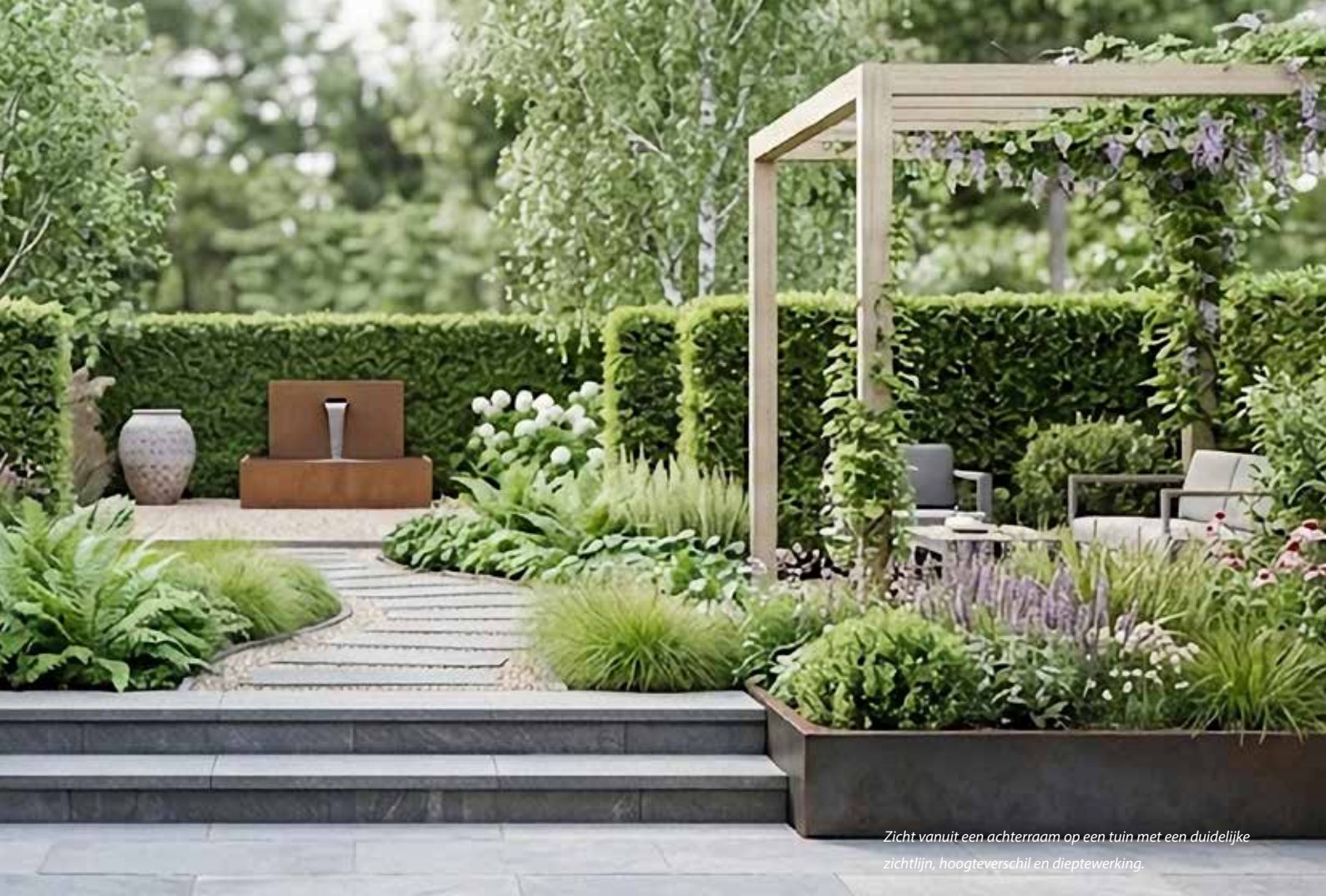
Zicht vanuit een achterraam op een tuin met een duidelijke zichtlijn, hoogteverschil en dieptewerking.