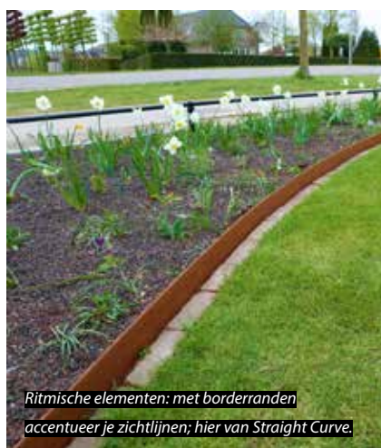
Ritmische elementen: met borderranden accentueer je zichtlijnen; hier van Straight Curve.