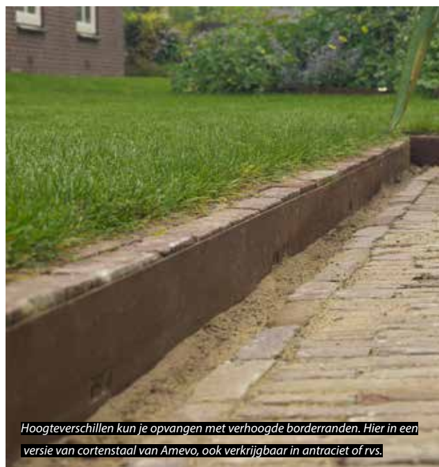
Hoogteverschillen kun je opvangen met verhoogde borderranden. Hier in een versie van cortenstaal van Amevo, ook verkrijgbaar in antraciet of rvs.