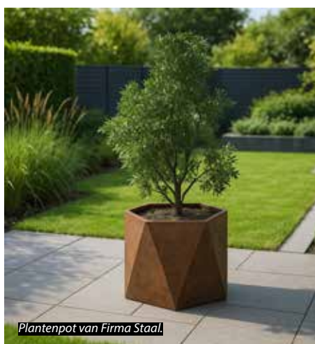
Plantenpot van Firma Staal.