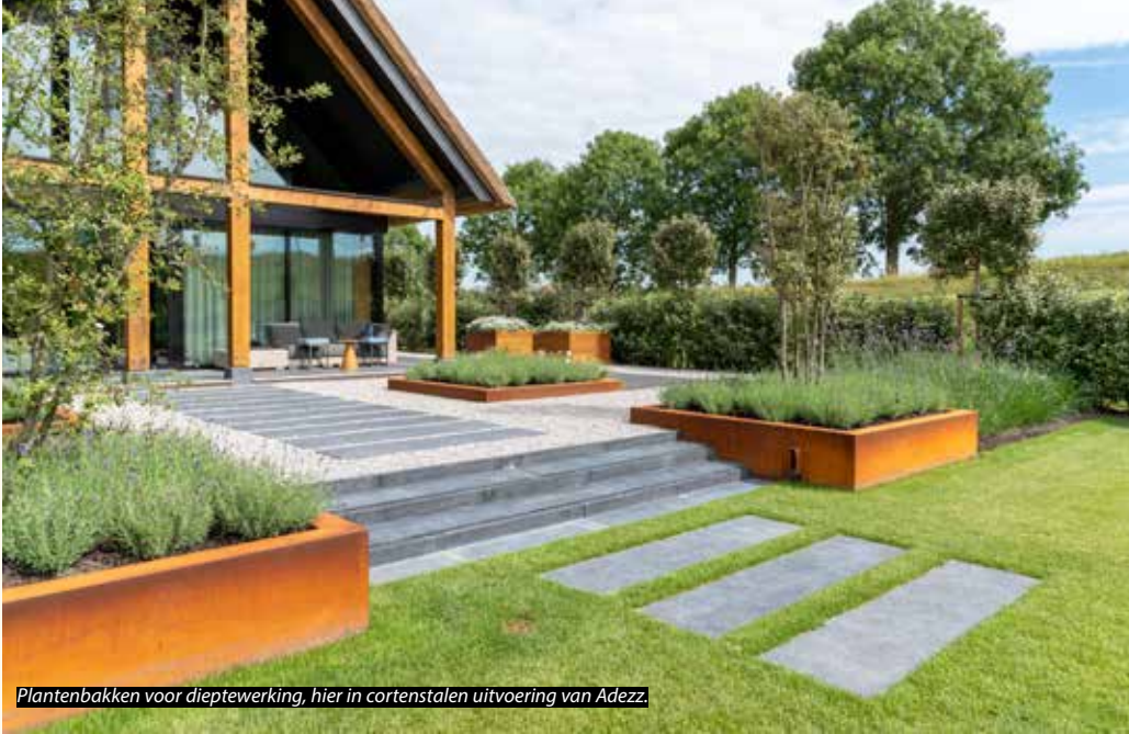
Plantenbakken voor dieptewerking, hier in cortenstalen uitvoering van Adezz.