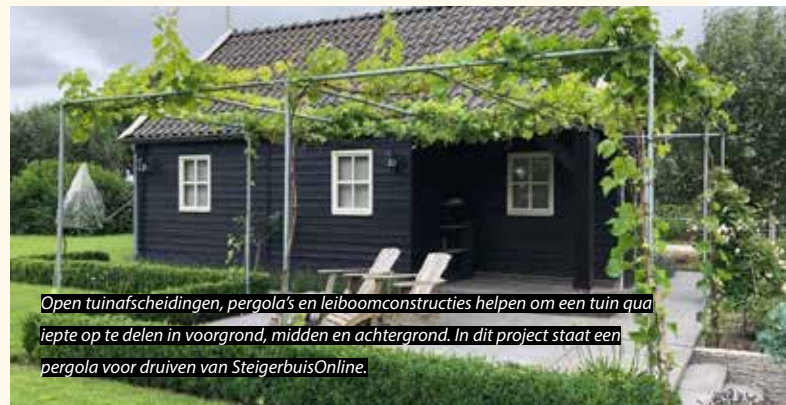
Open tuinafscheidingen, pergola's en leiboomconstructies helpen om een tuin qua diepte op te delen in voorgrond, midden en achtergrond. In dit project staat een pergola voor druiven van SteigerbuisOnline.

Poppelaars: 'Je kunt met een meerstammige heester al veel diepte creëren, zonder dat het teveel ruimte inneemt. Vergeet het groen niet! Bij de verdeling in voorgrond, middenzone en achtergrond moet je dus niet alleen zorgen voor afwisseling in materialen, maar ook tussen groen en (half)verharding.'