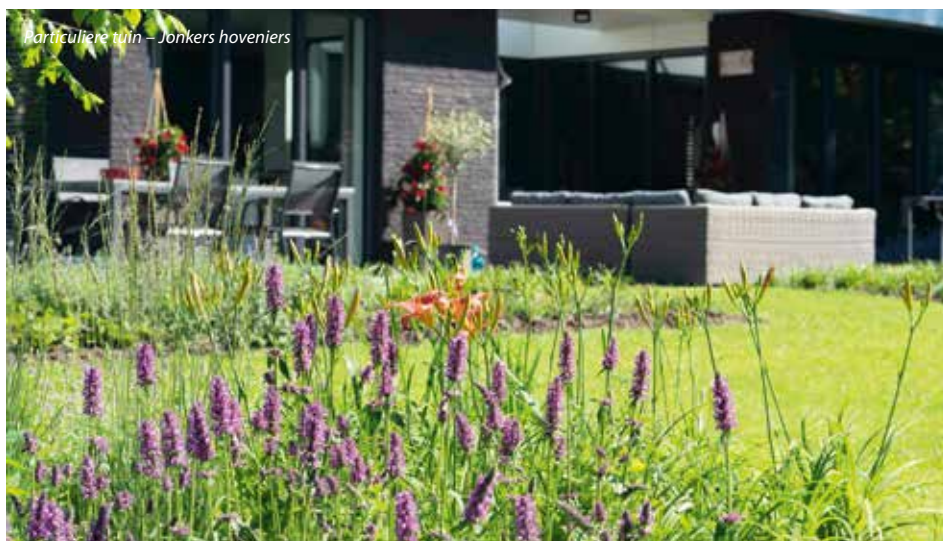
Particuliere tuin – Jonkers hoveniers