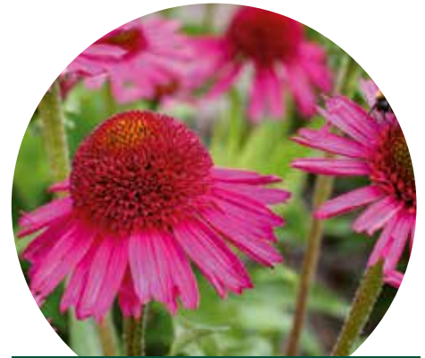
Echinacea 'Noordeli' DELICIOUS CANDY

Niemand weet hoe lang Cleopatra in het echt was, maar de naar haar vernoemde cultivar is een kleintje in het sortiment geelbloeiende zonnehoeden. Is E. 'Leilani' geschikt voor wat meer