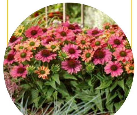
Echinacea 'Evolution Colorific'