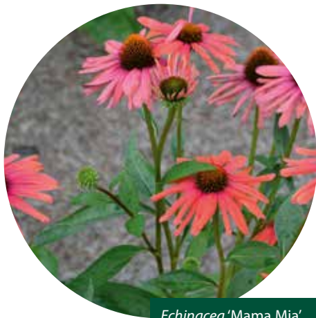
Echinacea 'Mama Mia'

Om tot een betrouwbare top 10 te komen, werd er natuurlijk gekeken naar de beste cultivars uit deze keuring