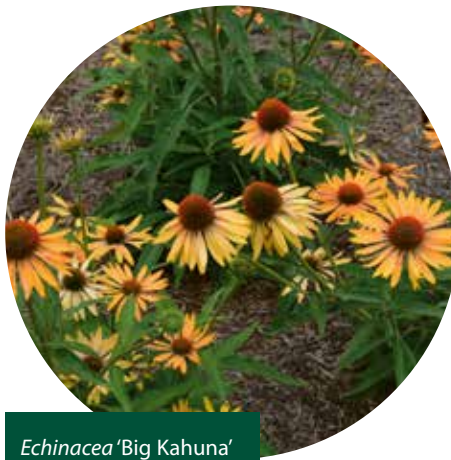
Echinacea 'Big Kahuna'

Eerst belichten we een paar 'Amerikanen' in deze top 10. Kwekerij Terra Nova introduceerde deze E. 'Leilani' , wat in het Hawaïaans 'hemelse bloem' betekent. Het is één van de beste geelbloeiende varianten, die met zijn 80 tot 100 cm bij de hoger wordende groep behoort. Je zou hem kunnen vervangen door een geelbloeiende Rudbeckia , maar door het duidelijke bloemhoofd in warm oranje heeft hij toch een heel andere uitstraling.