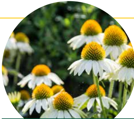
Echinacea purpurea 'Alba'