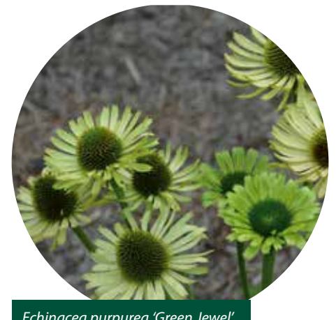
Echinacea purpurea 'Green Jewel'

Als laatste topper uit Amerika staat Echinacea 'Purity' in de lijst. Deze heeft een laagblijvende, mooie witte vorm, met grote 'egelskop' als hart. Door de compacte en goed vertakkende groeiwijze is het een prachtplant, die goed overeind blijft staan. Het blad van een witbloeiende zonnehoed is altijd lichter van kleur dan gemiddeld.