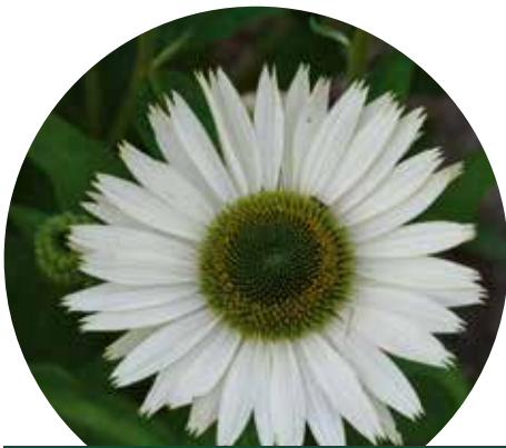
Echinacea purpurea 'Virginia'

Een jaar eerder werd E. 'Fatal Attraction' op de markt gebracht door onze beroemdste Nederlandse tuinontwerper, Piet Oudolf. Met zijn 60 cm hoort hij echt bij de lager blijvende cultivars. De intens roodpaarse bloemblaadjes op de bijna zwartgekleurde stelen maken hem uniek in het sortiment. Daarnaast vertakt de plant goed en geeft hij veel lintbloemen, waardoor de rand mooi gevuld is. Hij heeft ook donkerder groen blad dan de meeste andere cultuurvariëteiten.