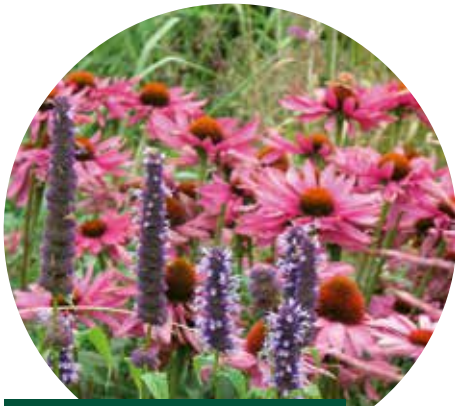
Echinacea 'Fatal Attraction'