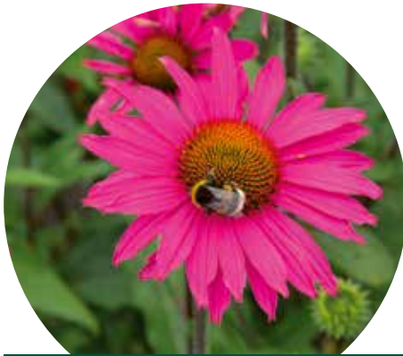
Echinacea 'Pink Shimmer'

Is het nu E. 'Virgin' of 'Virginia' ? In veel catalogi van vasteplantenkwekers staat E. 'Virgin' , maar volgens de Naamlijst houtige gewassen is het 'Virginia' . In Amerika is het E. 'Virgin' , maar in Europa was deze naam al lang geleden gekoppeld aan het Engelse plantenlabel Virgin, zodat deze niet gebruikt mocht worden voor de plant. Hier heet hij dus E. 'Virginia' ; wat een toestand om een plantennaam. Maar goed, ook deze introductie van Piet Oudolf werd bekroond met drie sterren dankzij zijn rijke bloei met stevige bloemstelen, en dat is toch het belangrijkste. Hij is met zo'n 80 cm middelhoog te noemen.