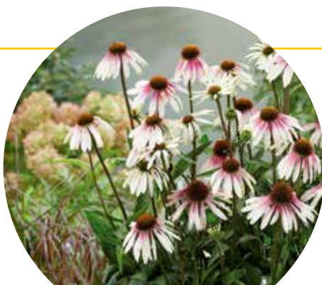
Echniacea 'Pretty Parasols'