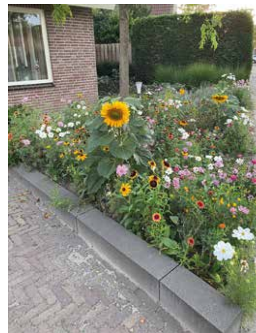
Veldbloemen zijn toe te passen in iedere tuin, zowel groot als klein. Links een grote landschappelijke tuin met een mengsel van Staygreen Grass en Veldbloemen 2, rechts een stadstuin met het mengsel Honey Bee.