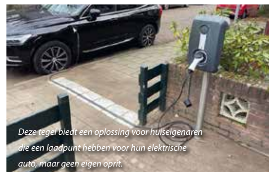
Deze tegel biedt een oplossing voor huiseigenaren die een laadpunt hebben voor hun elektrische auto, maar geen eigen oprit.

Hoogenboom adviseert dus wel om van tevoren even na te gaan bij de gemeente wat er wel en niet mag. 'Maar zodra de mogelijkheid er is, kunnen zowel particulieren als hoveniers de tegels plaatsen. Hoveniers kunnen ze plaatsen bij het opknappen of aanleggen van een voortuin, om het tuinproject mooi af te ronden.'