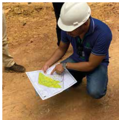
Managementplan voor FSC-gecertificeerde bosbouw

in het jaarvak voorkomen, hoe planten en dieren met elkaar leven in hun ecosysteem en waar foerageerplekken zijn. Wanneer er in een bepaald vak bijvoorbeeld een populatie chimpansees of een bedreigde vogelsoort voorkomt, mag daar dat jaar niet worden gekapt. Er wordt geregeld opnieuw een gebiedsscan gemaakt.'