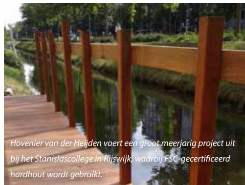
Hovenier van der Heijden voert een groot meerjarig project uit bij het Stanislascollege in Rijswijk, waarbij FSC-gecertificeerd hardhout wordt gebruikt.