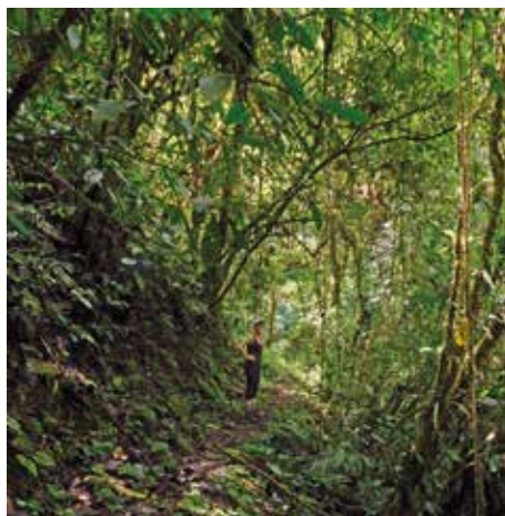
Lianne de Wit: 'Natuurlijke ecosystemen bevatten een schat aan biodiversiteit. In tropische regenwouden is de groei weelderig.'

Het hout dat selectief is gekapt, wordt bijeengebracht op verzamelplaatsen en naar een zagerij gebracht. 'In de lokale zagerij worden de stammen al verwerkt tot bezaagde planken of palen. Soms worden ze ook in de zagerij geschaafd, omdat FSC ernaar streeft, net als veel overheden en bedrijven, om zoveel mogelijk activiteiten in de keten in het land van herkomst te houden. Zo zet de overheid van Gabon in op alleen maar FSC-bosbeheer in het land, en wil ze daarnaast meer werkgelegenheid creëren door bewerkingstappen in eigen land te houden door middel van exporttarieven. FSC Nederland speelt hier overigens een grote rol in