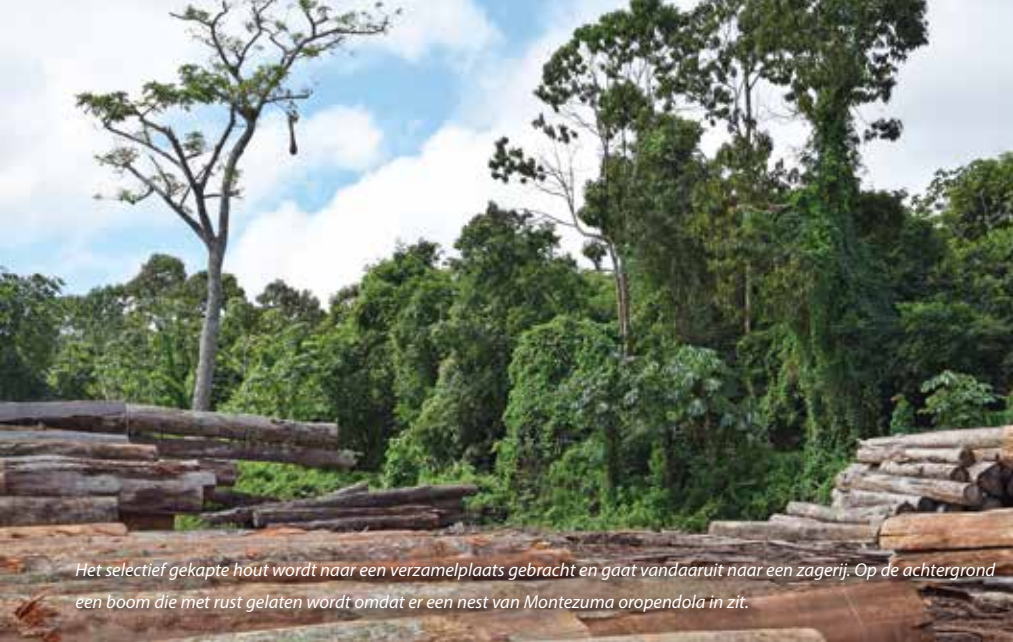
Het selectief gekapte hout wordt naar een verzamelplaats gebracht en gaat vandaaruit naar een zagerij. Op de achtergrond een boom die met rust gelaten wordt omdat er een nest van Montezuma oropendola in zit.