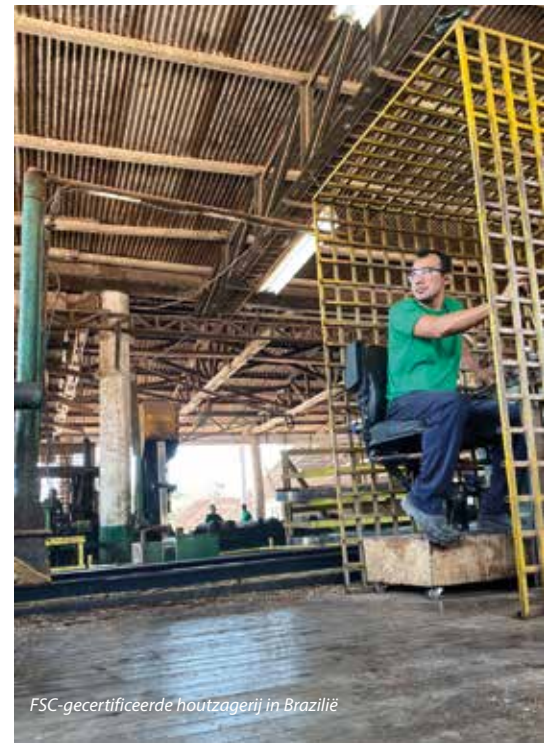
FSC-gecertificeerde houtzagerij in Brazilië