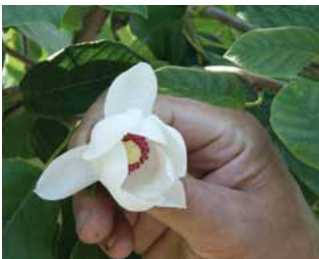
De Magnolia sieboldii kan ook gepland worden in de herfst, maar dan wel vanuit de pot vanwege het vleezige wortelstelsel.

Het vreemde is volgens de Betuwse handlaskweker dat hetzelfde geldt voor Duitsland, maar dat ze er in Frankrijk totaal anders over denken. 'Mijn Franse afnemers willen de bomen per se in het najaar.' In het algemeen geldt dat het aanslaan van een heester of boom steeds belangrijker wordt. Afnemers klagen steeds vaker als dat niet het geval is of willen een vervangend vergelijkbaar product. 'Dat is eigenlijk niet eerlijk, aangezien bomen in de herfst juist het beste aanslaan. Ik ben er dus een groot voorstander van als de herfst als plantmoment weer gemeengoed zou worden in Nederland en Duitsland.'