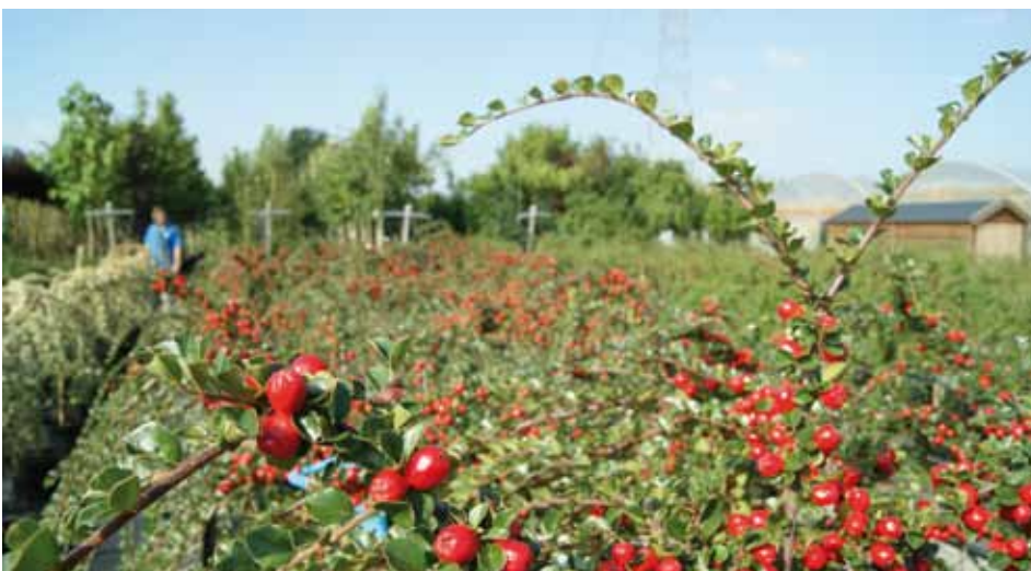
Ook een Cotoneaster pre. 'Boer' is een winterhard sierboompje.

De afgelopen jaren kozen veel consumenten voor mediterrane soorten. Huibers ervaart dat veel mensen hiervan gekomen zijn. 'Onder meer olijfbomen en laurierstruiken zijn de afgelopen winter of de winter daarvoor geheel of gedeeltelijk bevroren. Wij als bedrijf zien dat mensen hierdoor weer meer interesse krijgen voor inlandse soorten.' Soms kiezen ze ook voor varianten die sprekend op een soort lijken die ze eigenlijk in hun tuin zouden willen hebben. Zo lijkt de Pyrus sal. Pendula (grijze sierpeer) sprekend op een olijfboom, maar hij is winterhard. Ook de kleurige lijsterbes doet het momenteel goed. 'Er zijn in ieder geval genoeg alternatieven voor die mediterrane soorten. Ik vind dat de organisatie die eventueel een (promotie)project gaat opstarten dit ook moet uitdragen.'