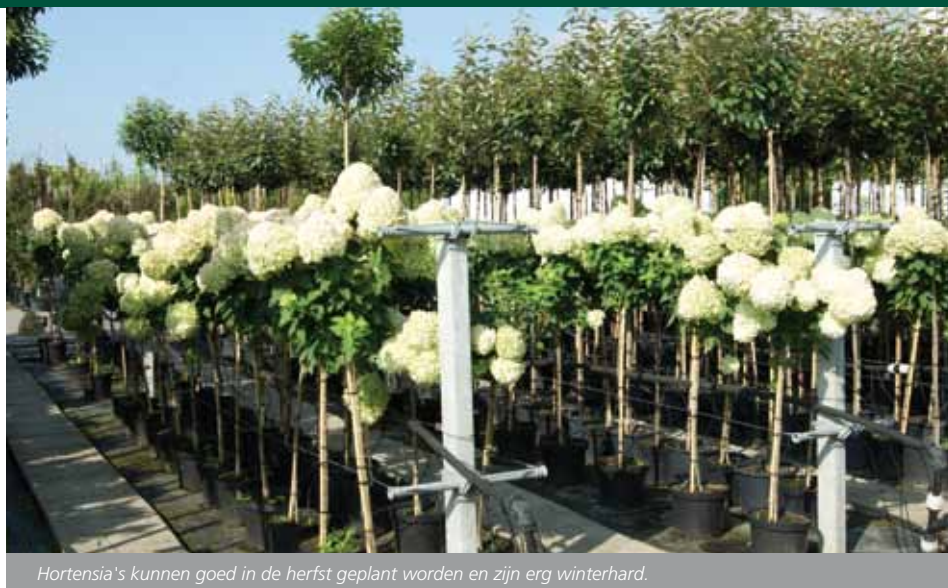
Hortensia's kunnen goed in de herfst geplant worden en zijn erg winterhard.