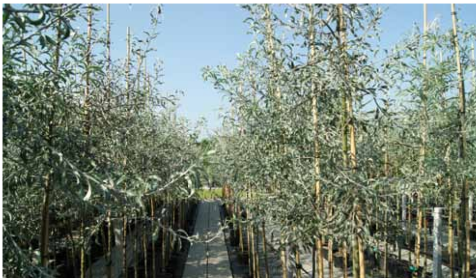
De Pyrus sal. 'Pendula' is winterhard en daarmee een goede variant als vervanging voor de olijfbom.

'In plaats daarvan moeten we per seizoen gaan denken en vervolgens onze marketing en acties daarop afstemmen.' Verder moet in de herfst veel meer gedaan worden met geur-, kleur- en lichtvalbeleving, vindt de beursmanager van Plantarium. Dit zou al kunnen gebeuren tijdens de komende Expo TCO in Opheusden op 1 en 2 oktober. 'Voor laanbomen geldt dat je er heerlijk onder kunt zitten, als we een relatief warme herfst krijgen. En je hebt natuurlijk bomen met de mooiste kleuren en bessen of vruchten.' Verder zou de laanbomensector de afnemers nog beter duidelijk kunnen maken dat je direct kunt genieten van heesters en bomen die vanuit de pot- en containerteelt worden geplant, vindt Van Lint, en dat de herfst het beste seizoen blijft om heesters en bomen te planten. 'Probeer te blijven nadenken over de wensen van je eindgebruiker. En daarbij moet je tegenwoordig naar de wensen per deelsector kijken, niet in het algemeen.'