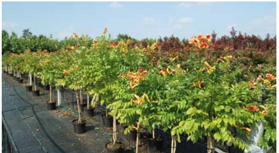
De Campsis tagl. 'Indian Summer' groeien nog de hele maand september door; in de herfst kan je ook van heesters met bloemen genieten.

Volgens Van Lint kopen consumenten in het voorjaar 'verwachting'. De planten hebben op dat moment nog niet de pracht die ze gaandeweg de lente, zomer en herfst krijgen. 'Op het label staat vaak wel hoe de plant zal gaan bloeien en of hij bijvoorbeeld mooie bessen voortbrengt. In de zomer- en herfstperiode moeten we in de marketing, denk ik, toe naar een andere idee. Dan koop je 'plezier': de heester of boom staat in bloei.' Volgens Van Lint kan de sector daar heel veel mee doen. Aan de consument moet duidelijkgemaakt worden dat je ook in september, oktober en november kunt genieten van je tuin. Wel op een andere manier, maar net zo goed als in het voorjaar. Zo kan de nadruk in de herfst gelegd worden op het feit dat de heesters en bomen meteen al heel mooie bloemen, zaden of bessen hebben. Hierbij zouden volgens Van Lint zowel kwekers als tuincentra eens moeten afwijken van de 'veilige', standaard vaste planten, heesters en boomsoorten die nu vaak in de herfst aangeboden worden. 'Ik denk dat we daarover zouden moeten nadenken en vervolgens een