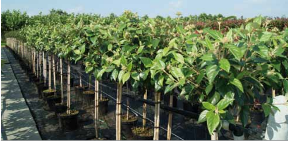
Viburnum 'Eskimo' is winterhard en erg mooi in de herfst. Hij houdt ook zijn blad en bloeit mooi in het voorjaar.

kweeper, Viburnum 'Eskimo', Cotoneaster n. 'Boer' of Malus 'Red Sentinel'. 'Een uiteraard alle Acer rubrum- en Liquidambar-soorten die in het najaar heel mooi worden als het blad begint te kleuren. Maak duidelijk dat je nog wekenlang kunt genieten van een prachtig kleurenpalet als je een Acer rubrum of Liquidambar vanuit de pot of container plant.'